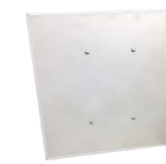
Кварцевые обогреватели «TEXTURE»-